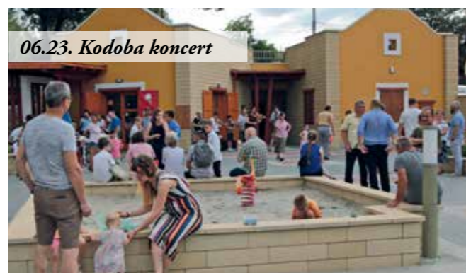
06.23. Kodoba koncert