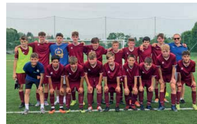
Az aranyérmes U15-ös csapat