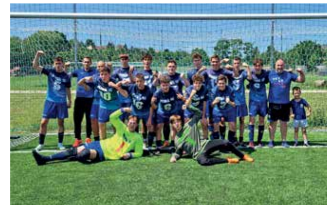
Az aranyérmes U19-es csapat