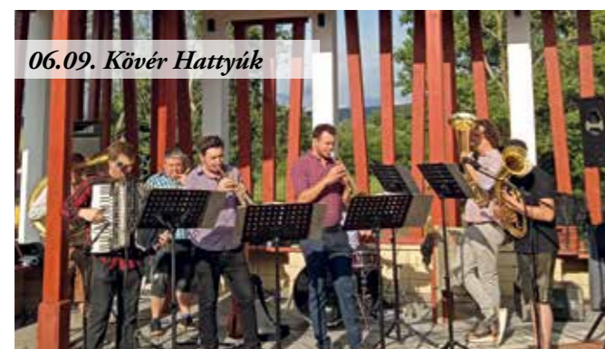
06.09. Kövér Hattyúk