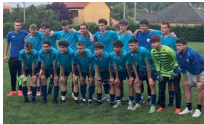
Az aranyérmes U17-es csapat

forogtatt a különböző posztokon. Több olyan meccset is sikerült megnyernie, ahol az ellenfél komolyabb játékerőt képviselt.