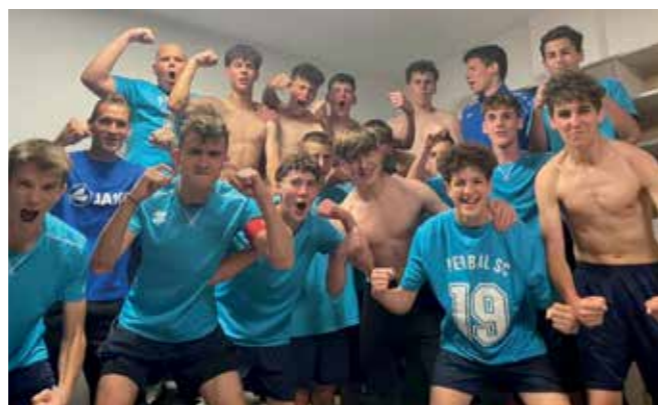
Örömmámor az U19-es csapat öltözőjében