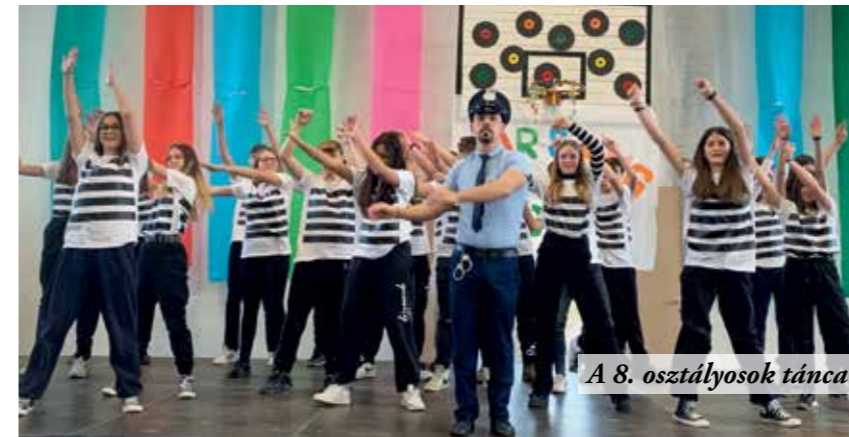
A 8. osztályosok tánca