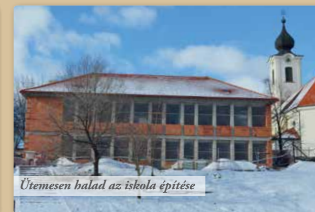
Ütemesen halad az iskola építése

Iskolabővítés - Jó ütemben folyik az új épület építése. A tetőszerkezet kivitelezése hamarosan befejeződik.