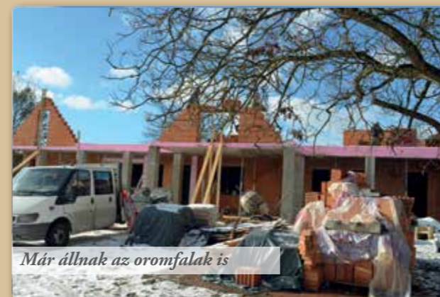
Már állnak az oromfalak is

A Plébániabővítés - A téli szünet után tovább folytatódik a plébánia bővítés építése. A tetőtér falait rakják.