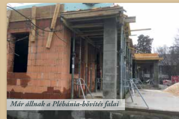
Már állnak a Plébánia-bővítés falai