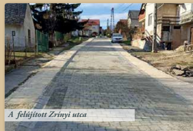
A felújított Zrínyi utca