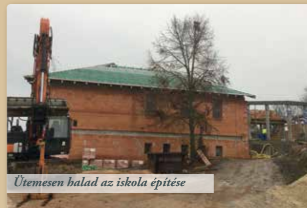
Ütemesen halad az iskola építése