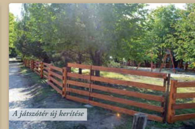
A játszótér új kerítése