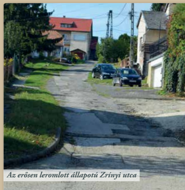
Az erősen leromlott állapotú Zrínyi utca

Zajlik az iskolabővítés; az alsó udvaron található kétszintes épület első szintje elkészült már a födémmel együtt. A régi épületet hamarosan a lábazatig visszabontják, ehhez még az illetékes Minisztérium jóváhagyására és finanszírozására várnak.