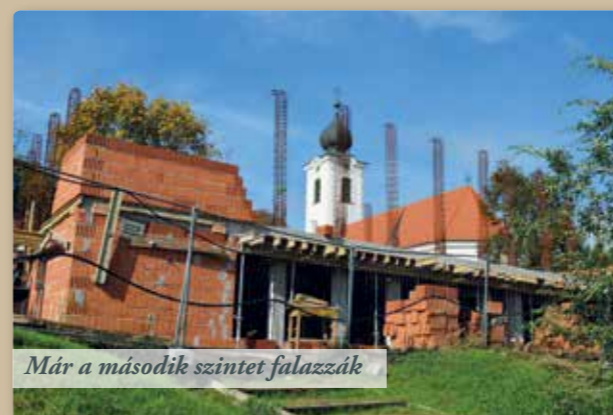
Már a második szintet falazzák