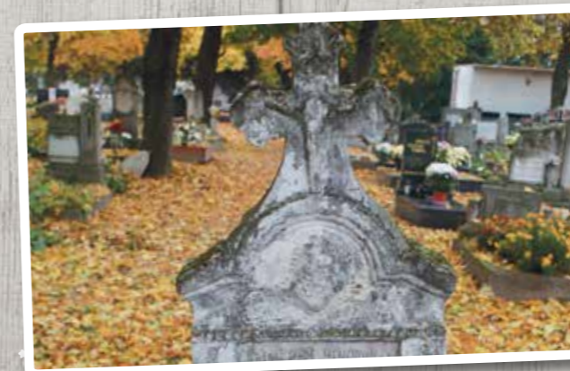
November - Halottak napja a temetőben