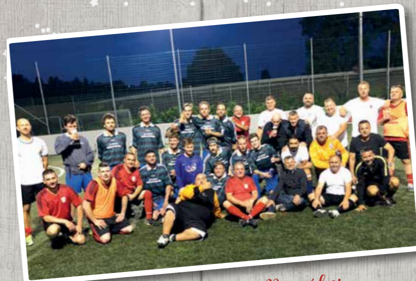
Július - Focitorna Búcsúkor