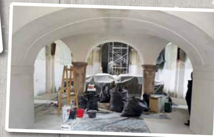
Augusztus - Szt Anna templom - elkezdődik a belső felújítás