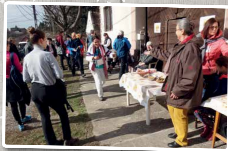
Február - Tavaszváró túra - a Patakok Életmód Egyesület a perbáli pihenőhely biztosítója