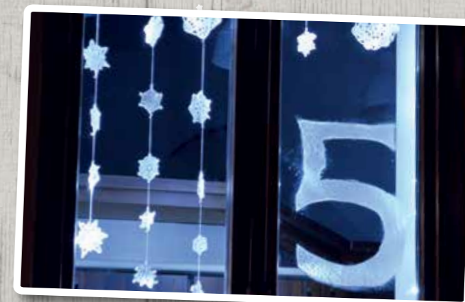
December - Adventi ablakok