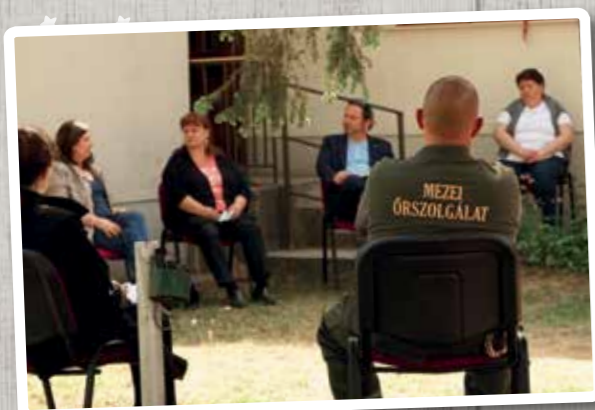
Május - Covid helyzet nálunk - ülésezik a HÖT