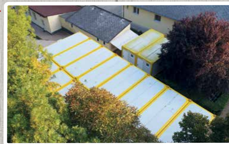
Szeptember - Konténertermekben kezdődik az új tanév - elkezdődnek az iskola bővítésének munkálatai