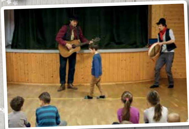
Január - Aligvárom meseműhely - Gyerekelőadás a könyvtár szervezésében