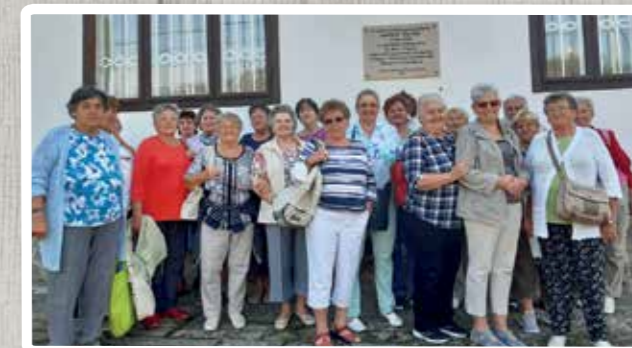
Október - A Nyugdíjas Klub - kirándulás Zebegénybe