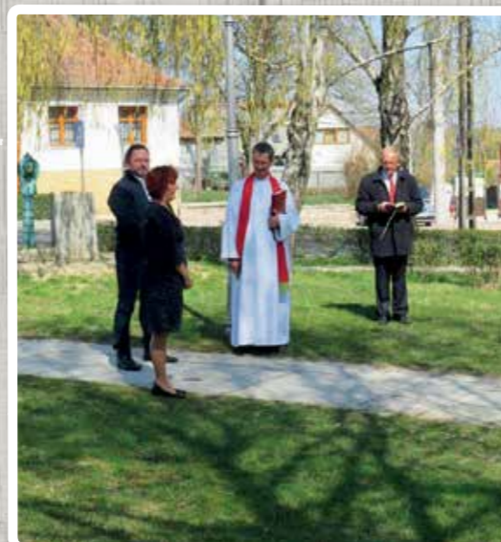
Április - Kitelepítési megemlékezés a helyi Német Nemzetiségi Önkormányzat szervezésében