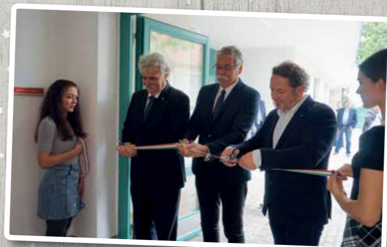
Június - Az Egészségház hivatalos átadója