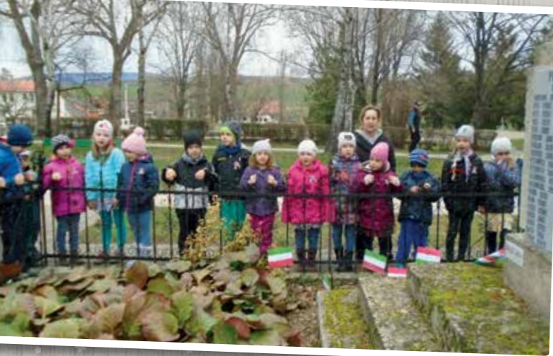
Március - Nemzeti ünnep az óvodásokkal