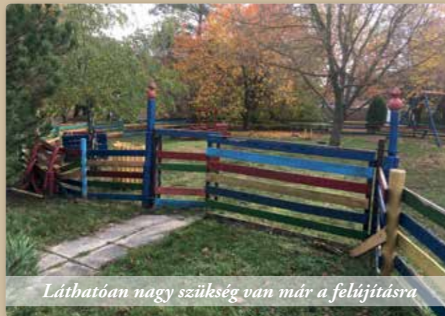
Láthatóan nagy szükség van már a felújításra

A lakótelepi játszótér megújítására elnyert pályázatunkra lefolytattuk az ajánlatkéréseket, ez eredményesen lezárult; azonban az időjárás, valamint a vállalkozás leterheltsége miatt a megvalósulás tavaszra marad.