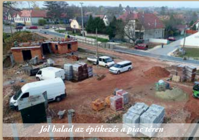
Jól halad az építkezés a piactéren

A jelenleg zajló legnagyobb volumenű önkormányzati beruházás a leendő piac tér és környezetének fejlesztése. A közműkiváltások, kiépítések után a szervízút és a Táncsics-köz burkolata elkészült. Jelenleg a piac kiszolgáló épületének és magának a piac térnek az építése folyik a terveknek megfelelő ütemben.