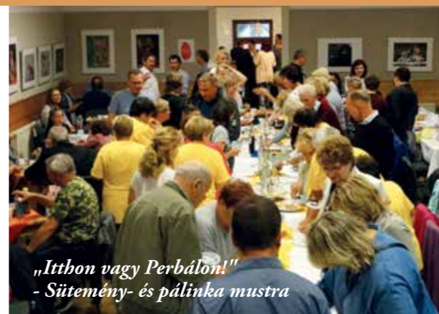
„Itthon vagy Perbálon!” - Sütemény- és pálinka mustra

keresztül. A legnépszerűbb hagyományápoló programunk az „Itthon vagy Perbálon”- sütemény- és pálinka mustra. „Szomszédolunk”, felfedezzük a környező falvak szépségeit. Részt veszünk az általános iskola