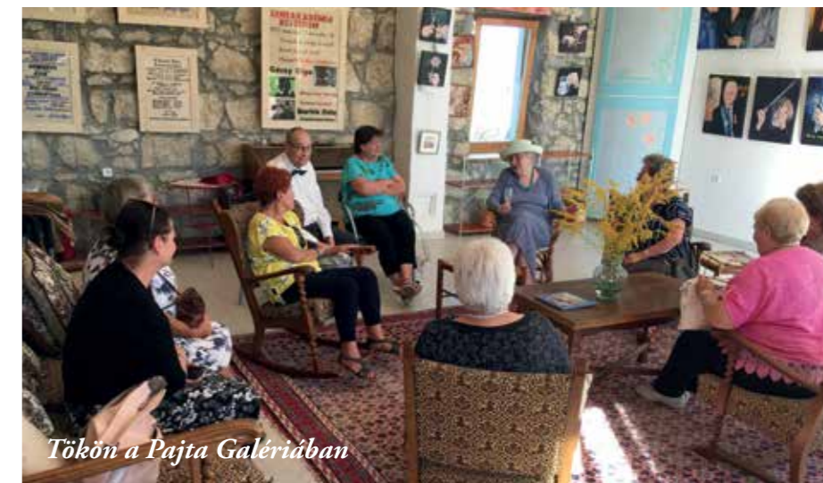
Tökön a Pajta Galériában

- Egyesületünk élmény-centrikus, egyéni aktivitást és kooperációt feltételező módon. Programjainkat meghirdetjük más egyesületek tagjai számára is vagy személyesen szólnak azoknak, akiket érinthet,