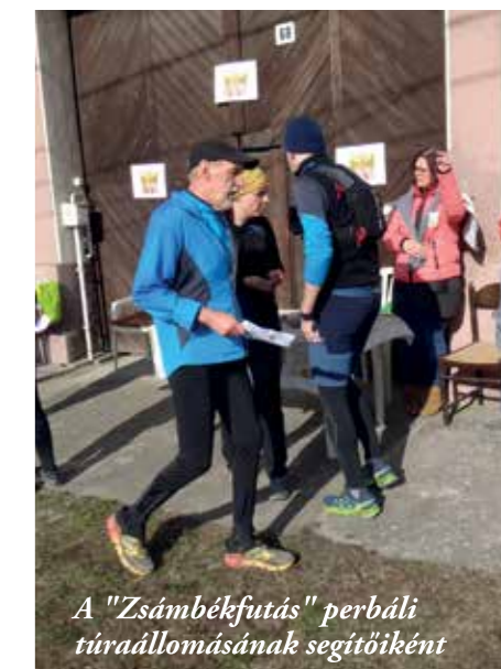
A "Zsámbékfutás" perbáli túraállomásának segítőiként