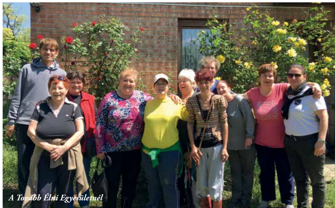
A Tovább Élni Egyesületnél

Az általános iskola megkezdésétől szinte folyamatosan részt vállalok a közösségi tevékenységekben. Ezt