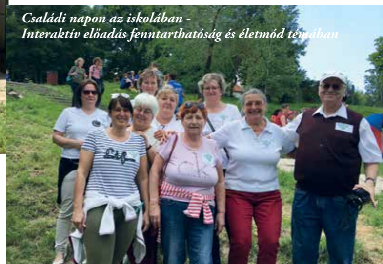
Családi napon az iskolában - Interaktív előadás fenntarthatóság és életmód témában

- Vigyázunk egymásra. A tagjaink egy része már a „védett korúak” kategóriájába tartozik, így tavasz óta a személyes találkozásokat ritkítottuk. De ez nem azt jelenti, hogy elszakadtunk egymástól. Létrehoztuk a Patakok Életmód