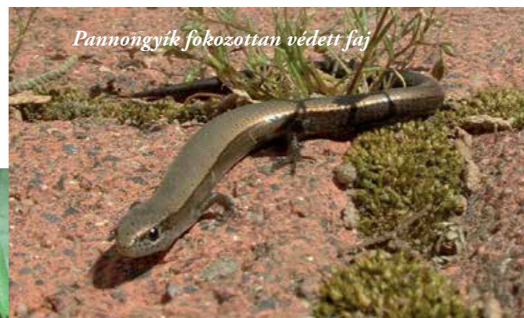
Pannongyík fokozottan védett faj

leginkább a Nagy-Kopaszi tömb térségében él, míg a zavarást jobban elviselő őz igen gyakori még a Budai kiránduló övezetben is. Ragadozók közül gyakori a róka és a borz, a települések közelében a nyest. A védett emlősök közül fontos megemlíteni az erdőlakó és a barlangokban áttelelő denevéreket. Az ürge nagy állományai a legeltetés felhagyásával eltűntek, mára főként a sportrepülőtereken találni őket, ahol a gyeper rendszeresen kaszálják.