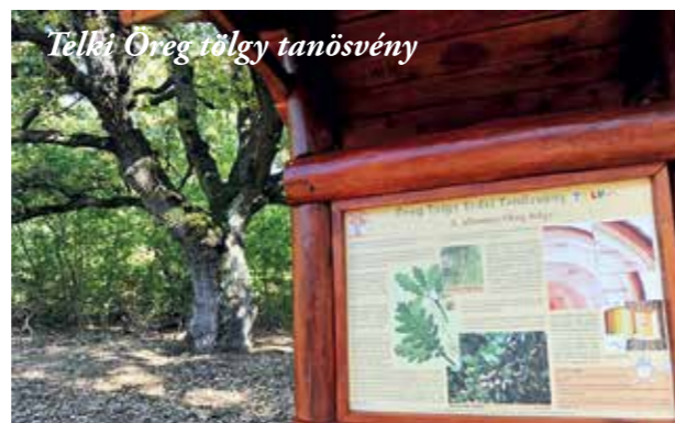
Telki Öreg tölgy tanösvény

Bővebb információk a tanösvényekről: https://www.dunaipoly.hu/hu/helyek/tanosvenyek/