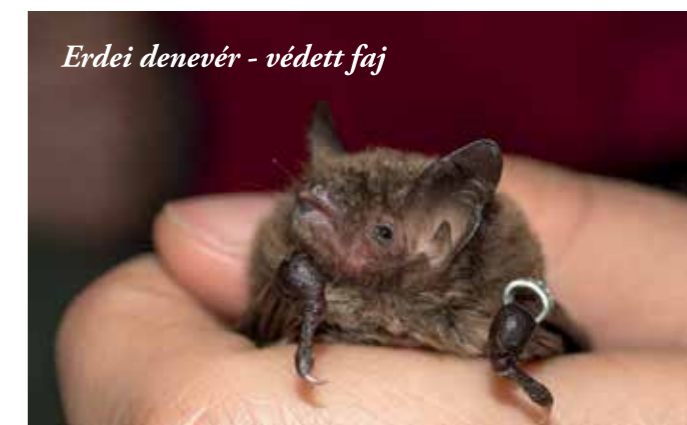
Erdei denevér - védett faj

A Budai Tájvédelmi Körzetről bővebben: https://www.dunaipoly.hu/hu/helyek/vedett-teruletek/budai-tajvedelmi-korzet/budai-tajvedelmi-korzet