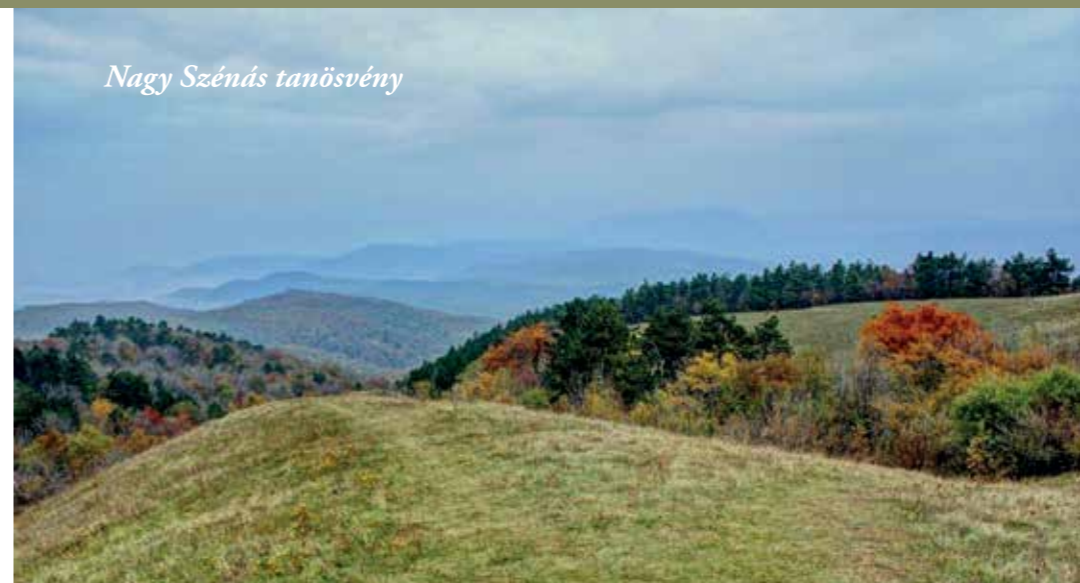
Nagy Szénás tanösvény

EREKLYENÖVÉNYEK: melyek régmúlt idők tanúiként maradtak fenn és fajtársaiktól elszigetelődve önálló fajjá váltak.