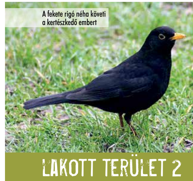
A fekete rigó néha követi a kertészkedő embert