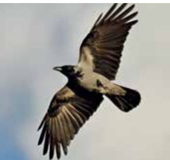
A varjúfélék mozgást is használnak a távközlésben