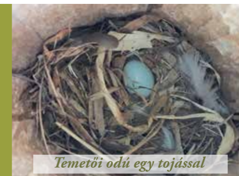
Temetői odú egy tojással