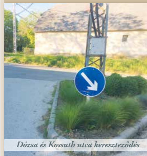
Dózsa és Kossuth utca kereszteződés

A Perbál SC sporttelepére is fokozatosan tér vissza az élet, elindultak az edzések, a civilek is újra használhatják a létesítményt. Ennek aktuális feltételeiről azonban előtte tájékozódjanak!