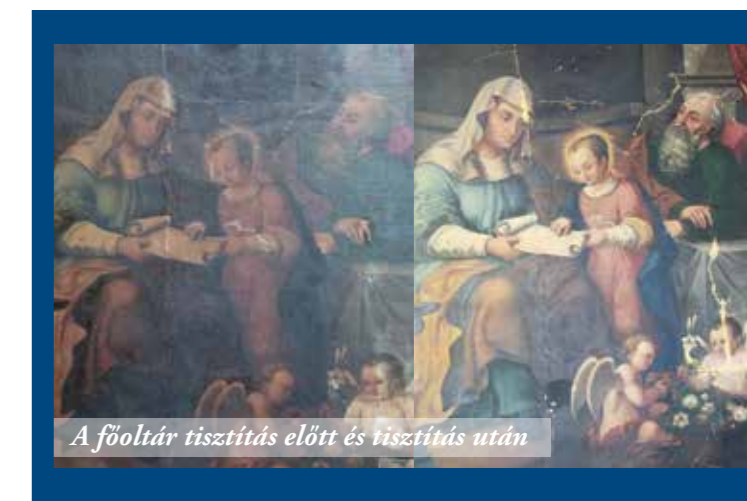
A főoltár tisztítás előtt és tisztítás után