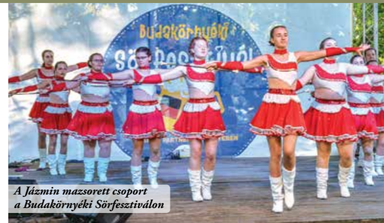
A Jázmin mazsorett csoport a Budakörnyéki Sörfesztiválon

A Határjárás szombatjának reggelén a Polgármesteri Hivatal elől indultunk, első utunk a Perbál-Tinnye határkö beállításához vezetett. Innen a Kopasz-hegyre gyalogolt tovább a határjárók csapata, kissé megfeszített tempóban.