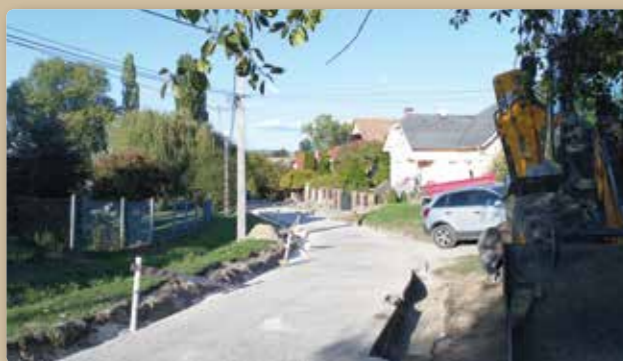
Folytatódik a Szabadság (Zöldfa) utca felújítása