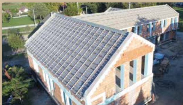
Jó ütemben balad az Egészségház építése