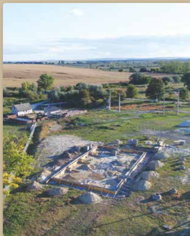
Az iparterület fejlesztése