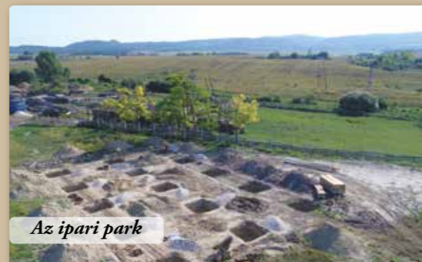
Az ipari park

Zajlik az egészségház tetőszerkezetének építése, ezzel párhuzamosan pedig már a belső munkálatok is - falazások, szakipari munkák - elkezdődtek. A beruházás a tervek szerinti ütemezésben halad.