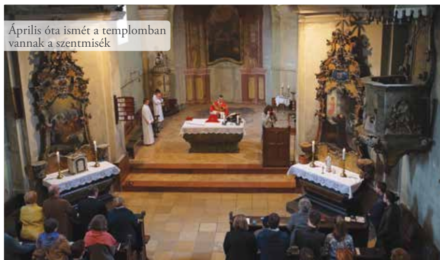
Április óta ismét a templomban vannak a szentmisék

A templomot kármentesítő cég márciusban befejezte a takarítást, melynek során megtisztította az épület belsejét a veszélyes anyagoktól. Április