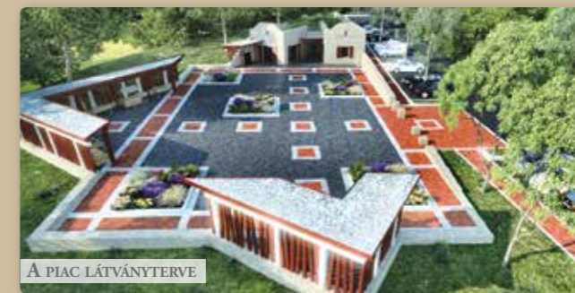
A PIAC LÁTVÁNYTERVE

Piac kialakítására beadott pályázatunk támogatásáról március végén örömmel értesültünk. Ez a pályázat is a Pest megyei ún. kompenzációs keretből lett meghirdetve, s az agglomerációs települések piacainak kialakítására, megújítására szolgál. Perbálon ezidáig nem volt tradicionális