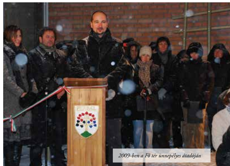
2009-ben a Fő tér ünnepélyes átadóján

dencei érdekeltséggel elkezdett építkezni, én pedig a pályázatok révén, - az összes környékbeli önkormányzatot megkeresve - kapcsolatokat alakítottam ki. Jó volt az időzítés, ami nem az én érdemem, nem volt ebben tudatosság. Egyszerűen csak jókor voltam jó helyen. Mint említettem, ekkor indultak az Uniós pályázatok és az önkormányzatoknak nem volt még ezen a téren igazán tapasztalatuk. Volt ebben tehát egy kölcsönösség: az önkormányzatoknak szükségük volt