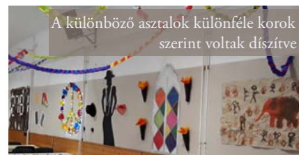
A különböző asztalok különféle korok szerint voltak díszítve