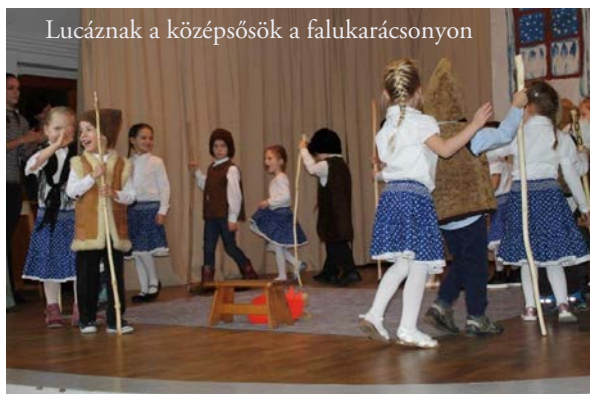
Lucáznak a középsősök a falukarácsonyon

Óvodánkban már-már hagyománnyá vált, hogy Karácsony táján az akkori középső csoportosok Lucázást mutatnak be a falu közönségének és az óvodás gyerekeknek egyaránt. Idén a Margaréta középső csoportosok ismerkedhettek meg a néphagyomány e töredékével és készültek lelkesen minden bemutatóra. A Luca napja köré fonódó szokások egyszerre jelenítik meg a varázslatot, a jószívűséget és a tréfát, így a gyerekek hamar megkedvelték a szokásokhoz kapcsolódó versiket, mondókákat, énekeket és hát persze a fiúk által mondott jókívánságokat. E szokás egyben lehetőséget teremt, hogy a gyerekek megéljék a régi, mindennapi élet mozzanatait, mint például a favágás, tűzrakás, fonás vagy gombócfőzés. A babonás tiltások és a mókás jókívánságok mindig jó hangulatot teremtettek a felkészülés alatt, így a gyerekek mindennap játékként élhették meg a gyakorlást. Mindemellett a gyakorlás és maga a bemutató is hozzájárult ahhoz, hogy önbizalmuk növekedjen, a csoport közössége alakuljon és az emberekkel való kapcsolatuk erősödjön.