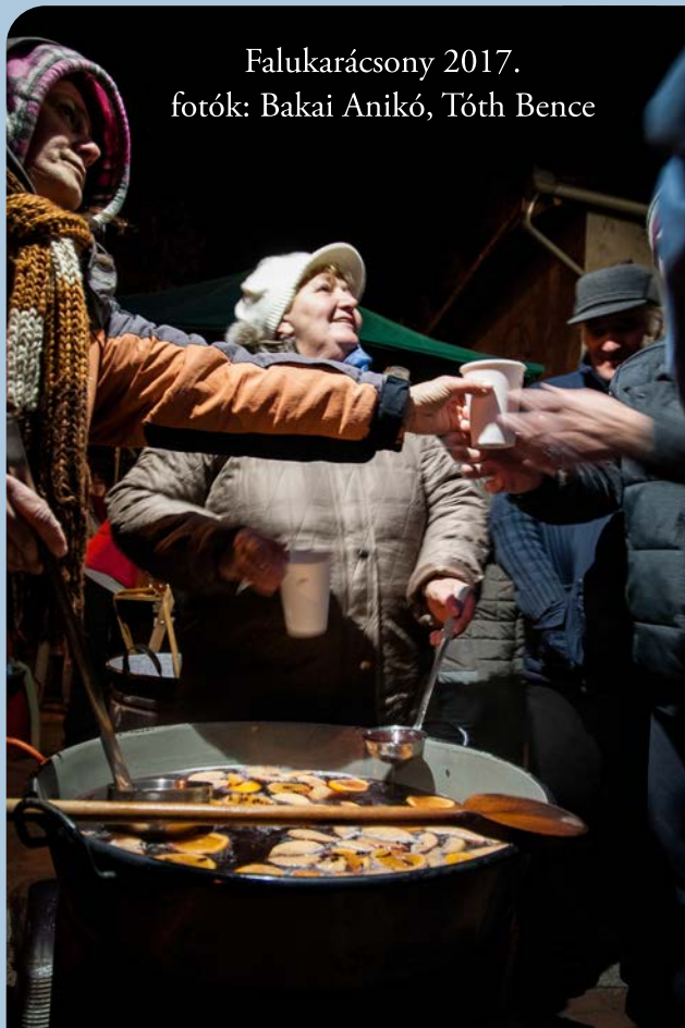
Falukarácsony 2017.