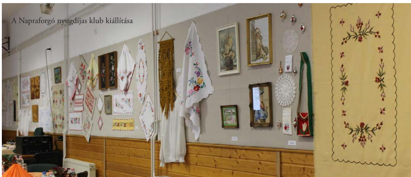
A Napraforgó nyugdíjas klub kiállítása