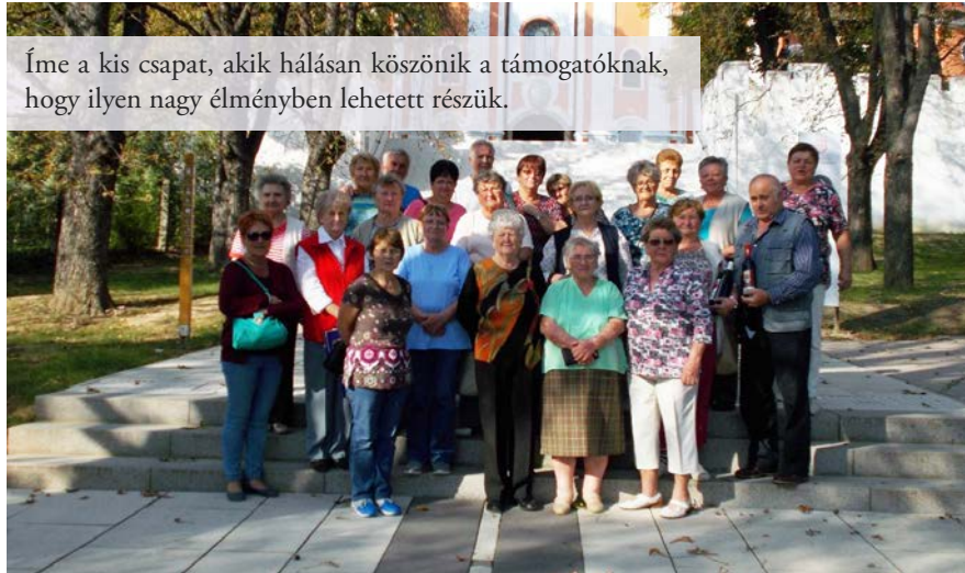
Íme a kis csapat, akik hálásan köszönik a támogatóknak, hogy ilyen nagy élményben lehetett részük.

két napra, kikapcsolódni. Az autóbusz elő-állt és mi boldogan a szép idő és a ránk váró élmények reményében elindultunk. A tájékoztató nyomtatványok a csoki bonbonok kíséretében fokozta a hangulatot. Első állomásunk Pécs volt, ahol megtekintettük a dómot és a város főterét.