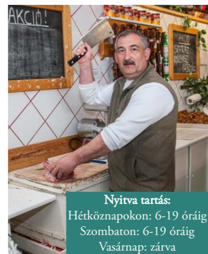
Nyitva tartás: Hétköznapokon: 6-19 óráig Szombaton: 6-19 óráig Vasárnap: zárva

Kereskedelmi iskolát végeztem a '80-as évek második felében, majd ezt követően üzletvezetői képzést. Először cégeknek dolgoztam; boltvezetőként különböző hús-, illetve élelmiszerüzletekben. Egy ideig boltok ellenőrzésével, karbantartásával is foglalkoztam. 1993-'98 között egyéni vállalkozóként vezettem a perbáli lakótelepen egy kis boltot. Utána Budapesten és Dorogon dolgoztam; hús-, illetve élelmiszer részleg vezető beosztásban.