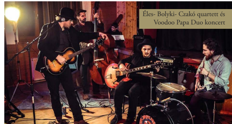
Éles- Bolyki- Czakó quartett és Voodoo Papa Duo koncert