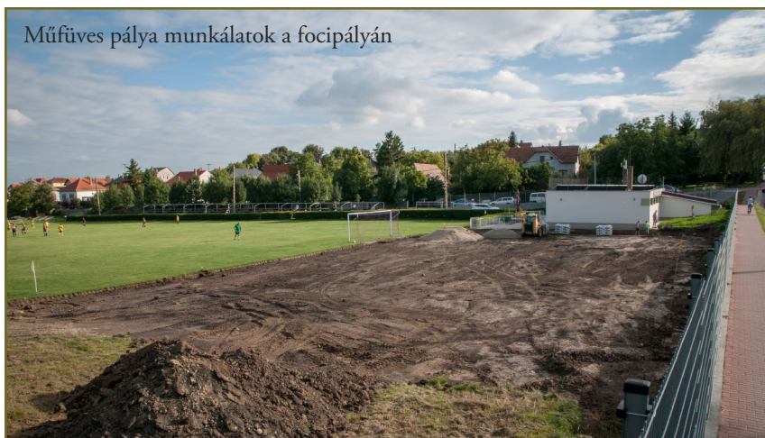
Műfüves pálya munkálatok a focipályán