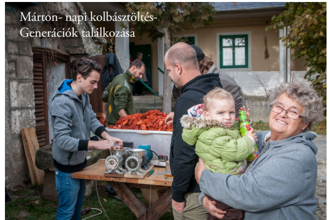
Márton-napi kolbásztöltés- Generációk találkozója