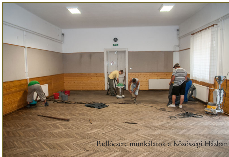
Padlócsere munkálatok a Közösségi Házban

A színpad is új borítást kap, valamint új, korszerű hang- és fénytechnika is kiépítésre kerül, így az őszi szezonkezdésre egy megújult Közösségi Ház várja a vendégeit!