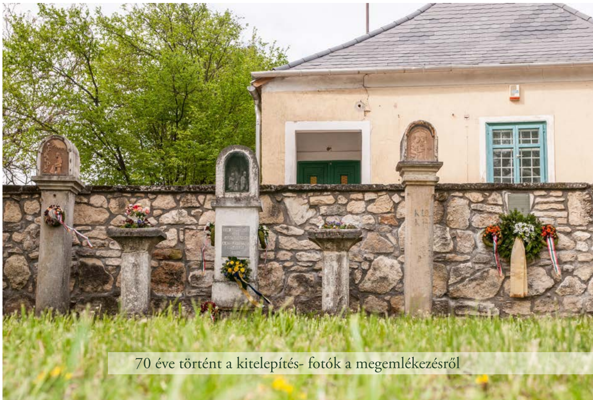
70 éve történt a kitelepítés- fotók a megemlékezésről