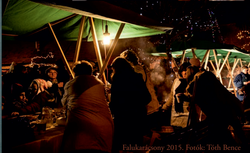
Falukarácsony 2015.