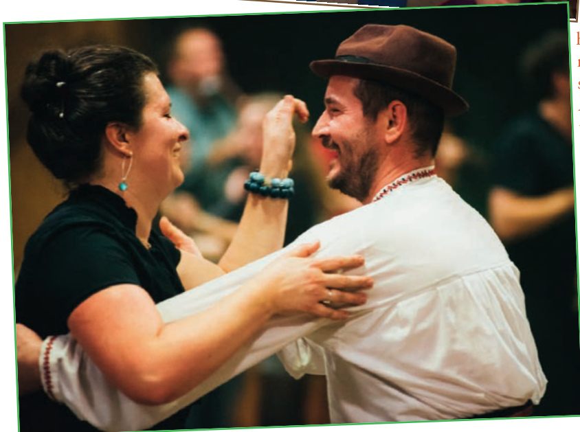
Csángó tánc és gyerekjáték a Közösségi Házban november 21-én.