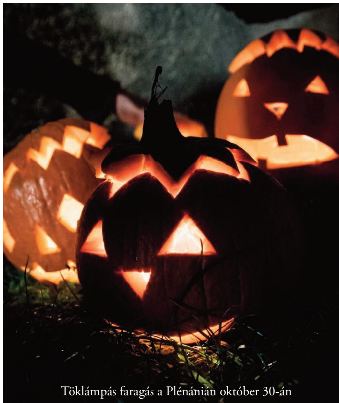
Töklámpás faragás a Plénánian október 30-án