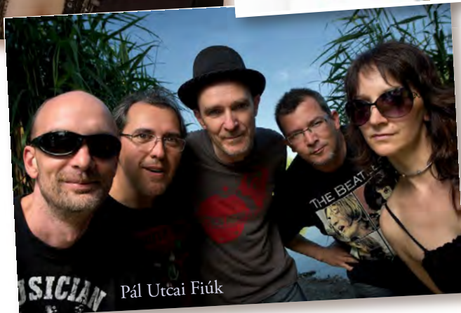
Pál Utcai Fiúk