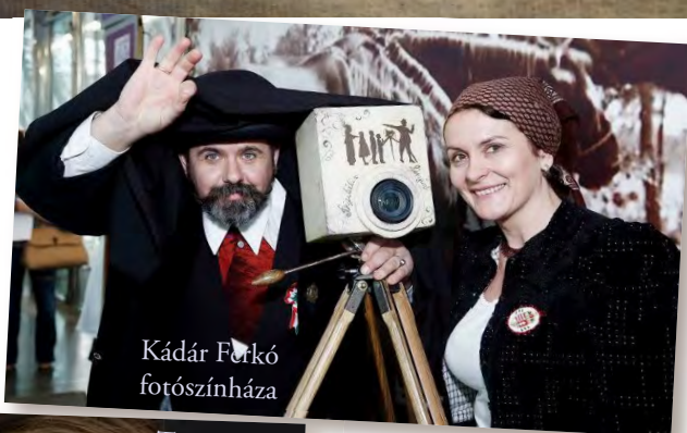
Kádár Ferkó fotószínháza